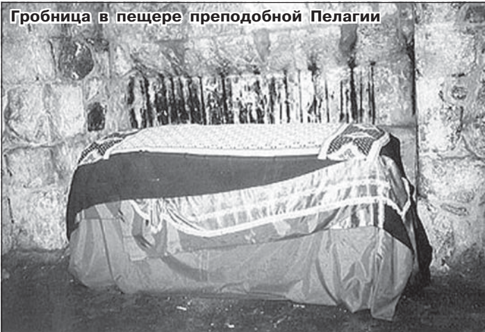
Гробница в пещере преподобной Пелагии

В квадратной формы грот, стены и потолок которого мусульмане выложили камнем, ведут крутые ступени. В обычные дни за посещение пещеры служители мечети взимают с каждого паломника плату – один доллар. Но раз в году – 21 октября, в день памяти преподобной Пелагии Антиохийской, называемой еще Елеонской и Палестинской, – мусульмане арабской деревни Аттур («Святая гора»), расположенной на самой вершине Масличной горы, позволяют православным христианам бесплатно спуститься в древнюю пещеру и помолиться на месте монашеских подвигов и вечного упокоения святой.