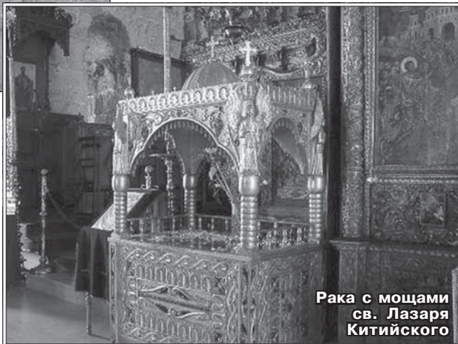
Рака с мощами св. Лазаря Китийского

Случилось это, по историческим меркам, совсем недавно – в 1972 году. В церкви святого Лазаря в тот год случился