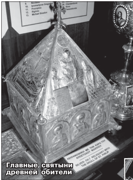
Главные святыни древней обители

подарила братии креста Животворящего Креста Господня и фрагмент веревки, которой были связаны руки Спасителя, когда Его вели на Голгофу. Эти святыни привлекли в монастырь еще боль-