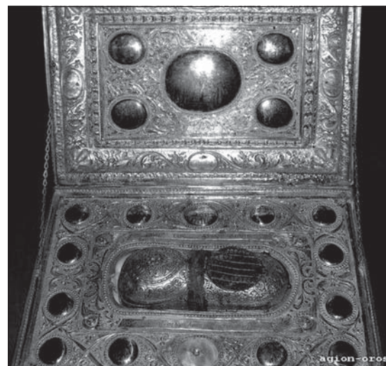
Подобно другим мощам – руке равноапостольной Марии Магдалины и руке мученицы Марины, которые сохраняют температуру человеческого тела, – остается постоянно теплой и стопа святой Анны

и, зная о чудесной помощи святой Анны, обратилась к святогорцам с просьбой получить частичку ее мощей, монахи одарили ее только иконой святой праведницы. Но осенью 2008 года традиция была нарушена и после трехлетних раздумий братия впервые в истории отде-