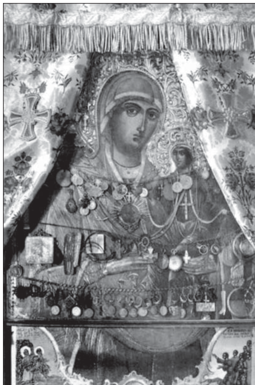
Еще одна скитская святыня – чудотворный образ святой Анны