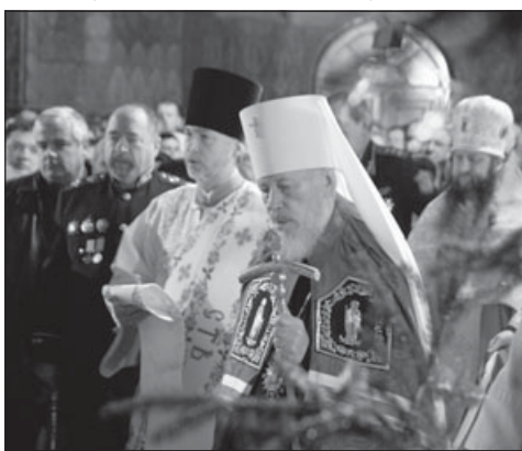
Рождественскую службу в Трапезном храме Киево-Печерской Лавры возглавил Блаженнейший Митрополит Киевский и всея Украины Владимир (Сабодан)

Расхождение старояюлианского календаря с астрономическим годом в один день накапливается за 128 лет, григорианского – за 3 тысячи 333 года, а новоюли-