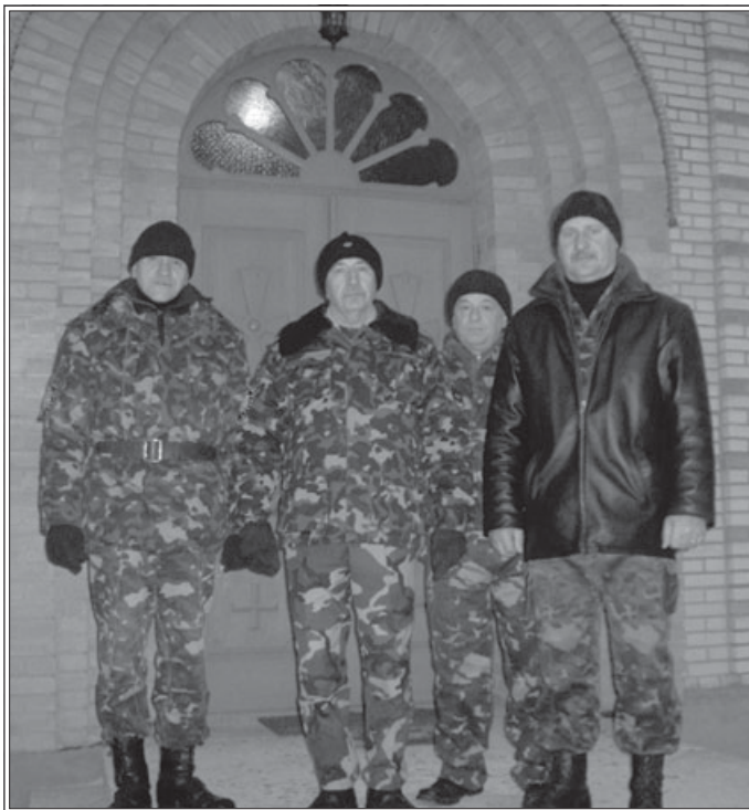
Новоград-Волынское отделение «Верного казачества» (Житомирская область) приняло решение о взятии под безвозмездную охрану всех церквей Новоград-Волынского благочиния Житомирской епархии Украинской Православной Церкви.

Между тем, в последнее время часто происходят случаи нападения на жителей культа, ограблений, поджогов храмов или осквернения их сатанинскими символами и оскорбительными надписями. В частности, минувшей осенью прогремел взрыв в храме на юге Москвы, был подожжен дом иеромона-