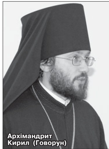
Архимандрит Кирил (Говорун)

Архимандрит Кирил (Говорун): Я хочу додати, що коли епископат Української Православної Церкви пропонував її Предстоятелю балотуватися на посаду Патріарха, то архиереї мали на