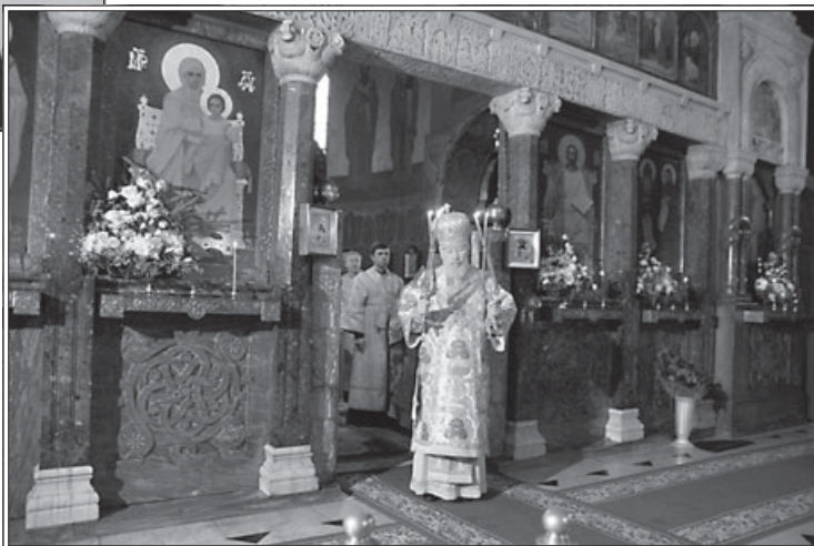
Перед зборами делегатів Предстоятель УПЦ звершив Божественну літургію у Трапезному храмі Києво-Печерської Лаври

Отже, сьогодні ми можемо впевнено казати, що канонічний статус, наданий Українській Православній Церкві вісімнадцять років тому, пройшов випробування часом. Він довів свою ефективність для вирішен-