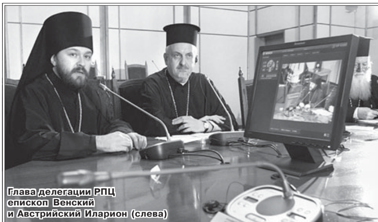
Глава делегации РПЦ епископ Венский и Австрийский Иларион (слева)

11 марта в Софии состоялось рабочее совещание представителей Поместных Православных Церквей, посвященное рассмотрению юридических и канонических вопросов, связанных с решением Европейского суда по правам человека от 16 декабря 2008 года. В этом решении суд обвинил власти Болгарии в нарушении 9 статьи Европейской конвенции о защите прав человека и фактически поддержал болгарских раскольников «митрополита» Иннокентия.