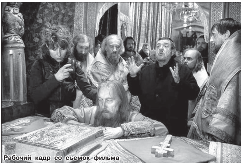
Рабочий кадр со съемок фильма

О: Делая кино, поневоле сталкиваешься с особенностями национальной психологии. Именно поэтому я и не смог работать во Франции – не понимаю их культурных кодов. С другой стороны, если ты делаешь продукт, то он должен быть понятным и в Африке, и в Японии, и в России. Это как сосиски – они везде одинаковые, пусть и с небольшими различиями. Так что в смысле коммерческом они правы. А в смысле уникальности художественного произ-