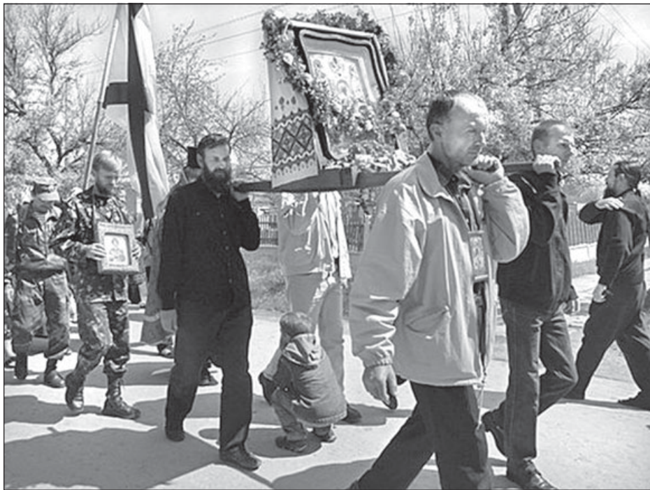
По благословию Блаженнейшего Владимира, Митрополита Киевского и всея Украины; Владимира, Митрополита Кишиневского и всея Молдавии; Лазаря, митрополита Симферопольского и Крымского, по территории Симферопольской и Крымской епархии проходит Международный пеший Крестный ход Кишинев-Севастополь. Кишинев-Севастополь – одно из направлений многовекторного Крестного хода, посвященного 65-летию Победы нашего народа в Великой Отечественной войне 1941-1945 годов, которое мы будем праздновать уже менее чем через год. Крестоходцы идут с чудотворными иконами Божией Матери «Знамение» Курская Коренная, «Умиление» (мироточивый образ, возглавлявший в 2007 году Крестный ход из Сарова в Дивеево), вмч. Георгия Победоносца – благословение почившего Святейшего Патриарха Алексия II, а также прп. Серафима Саровского. Международный крестный ход завершится 24 мая – в день памяти святых равноапостольных Кирилла и Мефодия, учителей словенских. Украина Православная

1. 28 апреля 2009 года на сайте Сумской епархии Украинской Православной Церкви Киевского патриархата было опубликовано Открытое письмо-обращение к высшим органам государственной власти Украины и общественности, в котором