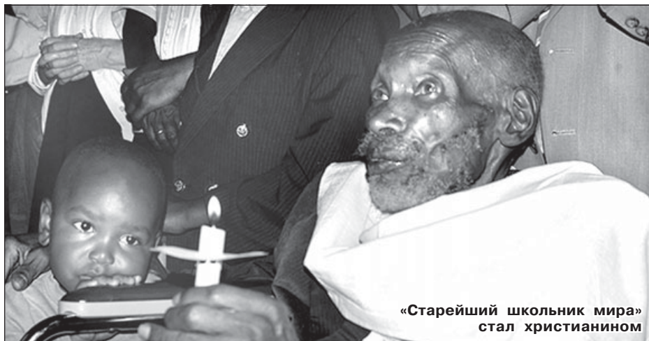
«Старейший школьник мира» стал христианином

своей сотрудницы носить крестик в кармане, объясняя это общими требованиями, согласно которым врачам нельзя носить ювелирные украшения. От нательного креста, по мнению руководства центра, может распространиться инфекция.