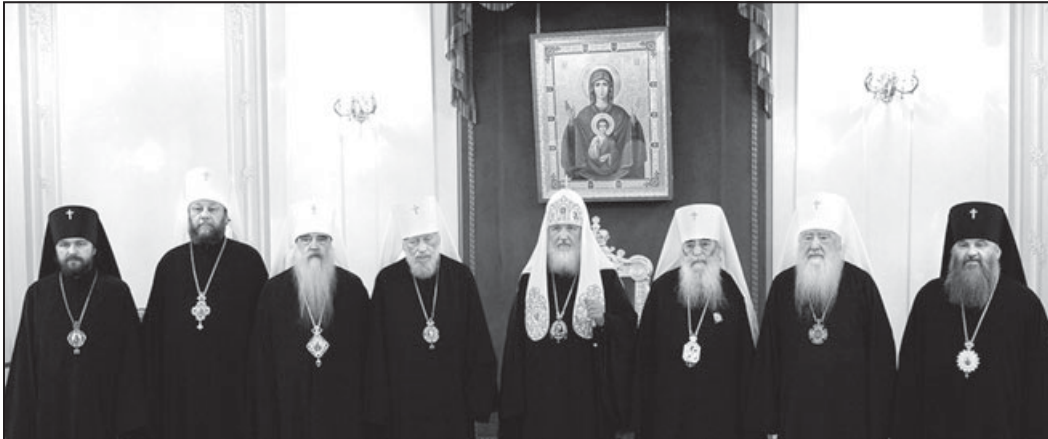
Члены Священного Синода РПЦ (слева направо): председатель ОВЦС МП архиепископ Волоколамский Иларион, митрополит Кишиневский и всея Молдовы Владимир, митрополит Минский и Слуцкий Филарет, Блаженнейший Митрополит Киевский и всея Украины Владимир, Патриарх Московский и всея Руси Кирилл, митрополит Санкт-Петербургский и Ладожский Владимир, митрополит Крутицкий и Коломенский Ювеналий, исполняющий обязанности управляющего делами Московской Патриархии архиепископ Саранский и Мордовский Варсонофий

Заседание Священного Синода РПЦ проходило под председательством Святейшего Патриарха Московского и всея Руси Кирилла. В соборании приняли участие Блаженнейший Митрополит Киевский и всея Украины Владимир, митрополит Санкт-Петербургский и Ладожский Владимир, митрополит Минский и Слуцкий Филарет, митрополит Крутицкий и Коломенский Ювеналий, митрополит Кишиневский и всея Молдовы Владимир, и.о. управляющего делами Московской Патриархии архиепископ Саранский и Мордовский Варсонофий, председатель ОВЦС МП архиепископ Волоколамский Иларион, а также митрополит Екатеринодарский и Кубанский Исидор, митрополит Донецкий и Мариупольский Иларион, митрополит Тульский и Белевский Алексей, архиепископ Берлинский и Германский Феофан, архиепископ Владивостокский и Приморский Вениамин.