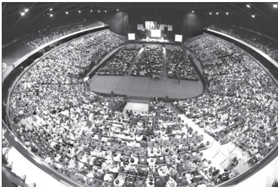
29 мая Святейший Патриарх Московский и всея Руси Кирилл выступил перед студентами высших учебных заведений Санкт-Петербурга, учащимися духовных школ, членами молодежных организаций. На вечере присутствовали свыше 8 тысяч молодых людей.

«Церковь может быть либо безразлична к людям, которые себя православными называют, но не живут церковной жизнью, либо она ставит своей задачей, чтобы эти люди стали активной частью церковного бытия, – продолжил Предстоятель. – Я думаю, что сегодня главная задача Церкви и заключается в том, чтобы это огромное количество людей, которые просто называют