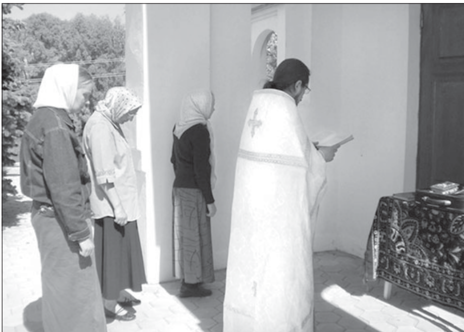
В праздник Вознесения Господня в с. Беево Сумской области состоялось праздничное богослужение, которое совершалось под открытым небом у стен Спасо-Преображенского храма, захваченного раскольниками УПЦ КП.

вые встретиться как рабочая группа, задача которой заключается в том, чтобы подготовить Межсоборное присутствие Русской Православной Церкви, относительно существования которого было выражено совершенно конкретное пожелание последнего Поместного Собора. Хотел бы вас проинформировать, что Священный Синод рассмотрел 31 марта тему Межсоборного присутствия и сформировал рабочую группу для того, чтобы создать этот очень важный орган церковного управления.