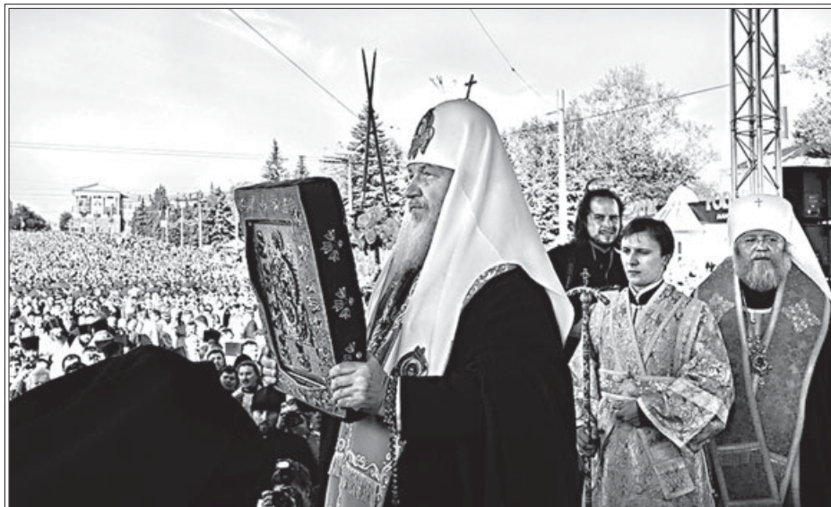
Более 50 тысяч жителей Курска и области собрались на Соборной площади и окрестных улицах на встрече чудотворной Курской-Коренной иконы. Чудотворный образ доставил в город Патриарх Кирилл. Он возглавил крестный ход со святыней по центральному проспекту к Знаменскому кафедральному собору, откуда почти 90 лет назад Курская-Коренная икона была увезена за границу.