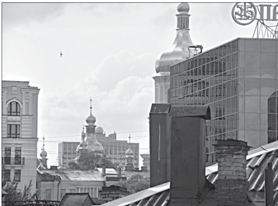
Строительство новых объектов в буферной зоне привело к тому, что грунтовые воды все ближе подбираются к архитектурным сооружениям, которые находятся на территории «Софии Киевской»

Разведенная 51-летняя мать четырех дочерей, М. Кессман была избрана главой ЕЦГ, объединяющей более 20 лютеранских и реформаторских церквей, на Синоде 28 октября. В ответ на это решение в Русской Церкви заявили, что не готовы в прежнем формате вести диалог с Евангелической Церковью в Германии, но при этом открыты к обсуждению существующих разногласий.