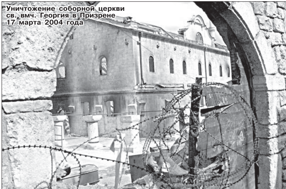
Уничтожение соборной церкви св. вмч. Георгия в Призрене 17 марта 2004 года

«Он позиционирует себя как очень православного человека, даже в общем-