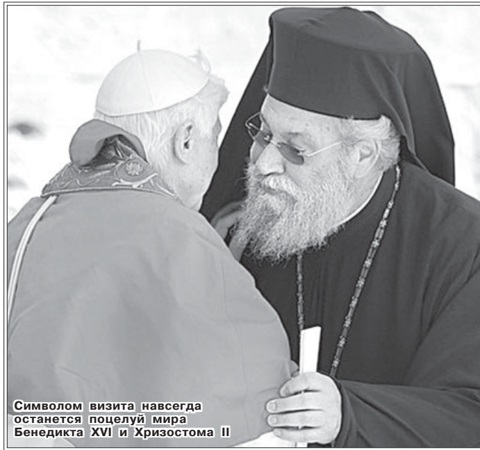
Символом визита навсегда останется поцелуй мира Бенедикта XVI и Хризостома II

Сам владыка Хризостом также подтверждает это мне-