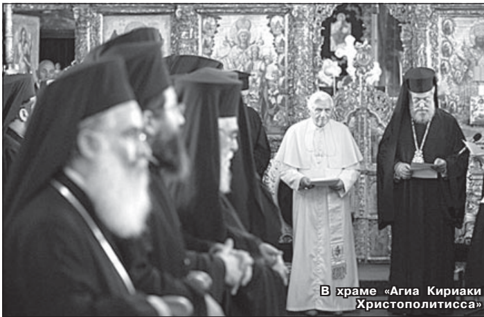
В храме «Агия Кириаки Хриstopолитисса»

К сожалению, уважаемые православные иерархи напрасно надеются на равное объединение. Напрасно они надеются на объединение в полноте догматической истины. С такими надеждами во Флоренцию ехал когда-то святой Марк Эфесский. В своих надеждах он жестоко обманулся. И по результатам Флорентийской унии он сделался горячим противником и латинства и униатства. Потому что никогда Римский