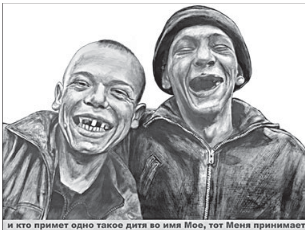
И кто примет одно такое дитя во имя Мое, тот Меня принимает

Отвечая своим критикам о. Максим отметил, что он рад возникшей дискуссии, потому что «одна из целей, кото-