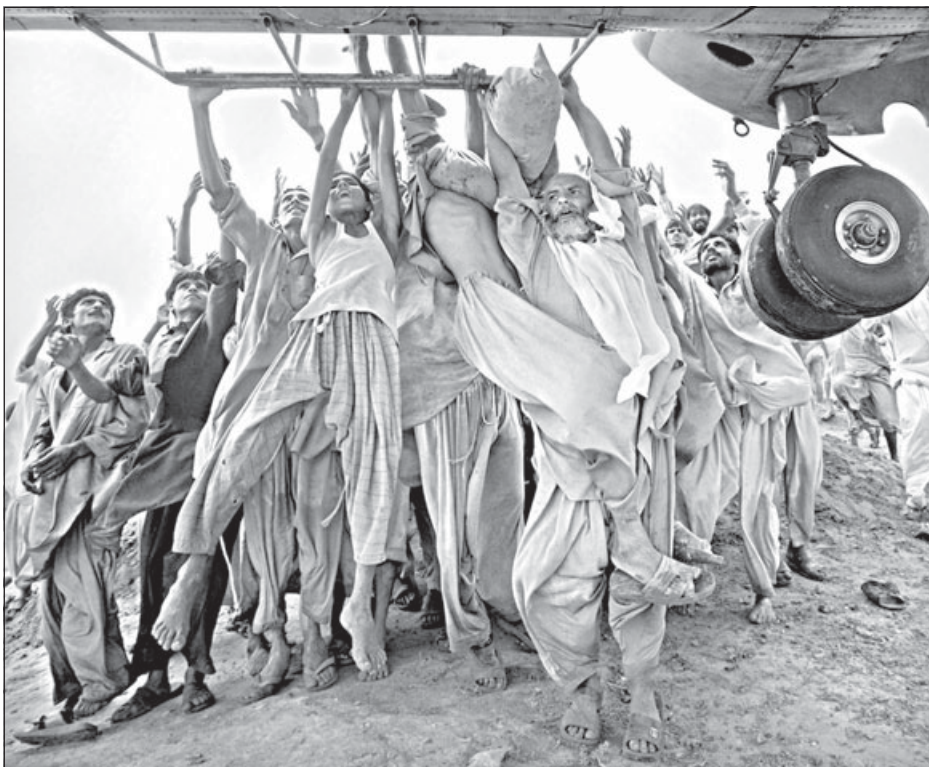
По последним данным от наводнений в Пакистане погибло более 1 600 человек и еще 12 миллионов пострадали. Христианские благотворительные организации помогают жителям страны, распределяя продовольствие и материалы из пластика, предназначенные для укрытия и оказывая медицинскую помощь. Сообщается, что итальянские епископы направили пострадавшим от наводнений миллион евро. Средства выделены из фонда добровольных пожертвований «восемь тысячных». Седмица.Ru. Фото: Люди отчаянно пытаются выбраться из затопленных деревень

Градоначальник столицы Нидерландов Эберхард ван дер Лаан убежден в необходимости просвещения учащихся