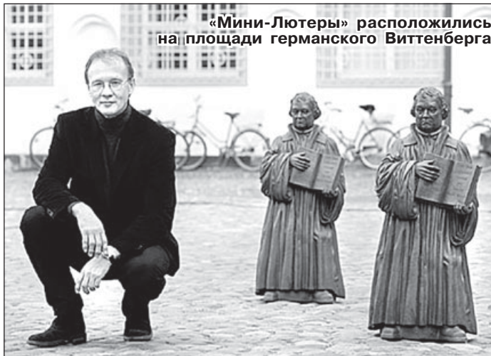
«Мини-Лютеры» расположились на площади германского Виттенберга