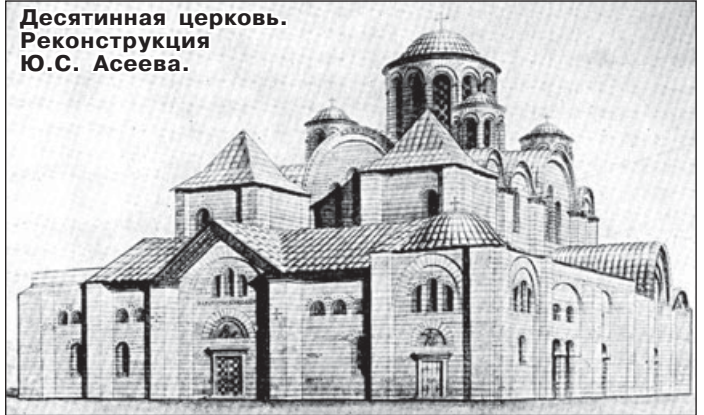
Десятинная церковь. Реконструкция Ю.С. Асеева.

сотрудничества в построении гражданского общества и позволит построить более гуманную систему человеческого общежития всех религий и вероисповеданий».